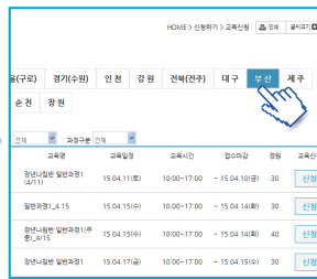
희망하는 '지역' 선택