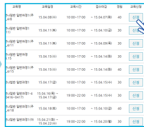
'교육일정' 확인 후 오른쪽 '신청'버튼 클릭